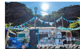
キッチンカーマルシェ