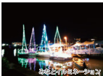
みなとイルミネーション